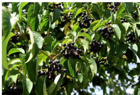
Wegedoorn (Johan vos)

We waren deze ochtend met z'n vijven en het in de voorzomer veelbelovende hoekje braakliggend terrein was, tegen onze verwachting in, toch gemaaid. Leuke soorten op rommelige, stenige hoekjes waren: Kleine zandkool, Kleine majer en Kransmuur. Als onderdeel van het struweel op het braakliggende terreintje als verrassing Wegedoorn, een struik die je in Zoetermeer, op het Buytenpark na, maar zelden aantreft.