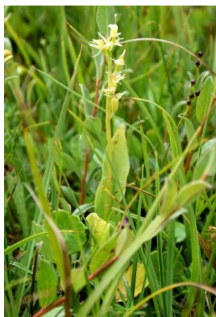
Groenknolorchis (Johan vos)

groeiden dan ook extra hard waardoor ze min of meer uit hun voegen (schors) barsten.