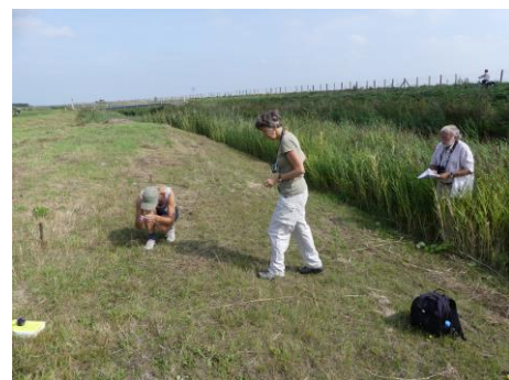
PQ's zijn gemaaid (Fred Reeder)

Zaterdag 8 september was een mooie, zwoele dag. Gelukkig was nog niet al het bloemrijk hooiland voor de tweede keer gemaaid en vooral de hoofdtocht leverde heel wat soorten op. Verrassend was dat we daar Akkerereprijs ( Veronica agrestis ) aantroffen, een soort die zich, tot nu toe alleen op volkstuincomplexen laat zien.