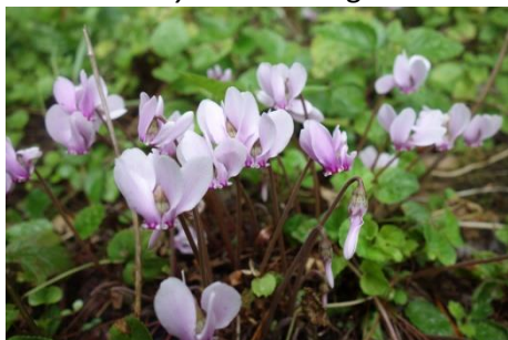
Cyclamen hederifolium. (Anneke Wagner)

Het woord Cyclamen is afgeleid van het Oudgriekse κύκλος, kuklos , dat cirkel of schietschijf betekent.