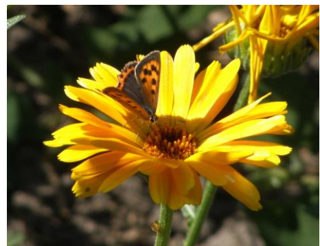
Kleine vuurvliinder (Tilly Kester)

Naast het Klein koolwitje was ook het Groot koolwitje aanwezig maar het blijft lastig om deze twee witjes, als ze niet stil zitten, van elkaar te onderscheiden. Verder zagen we een enkel exemplaar van het Icarusblauwtje en het Bruin blauwtje vliegen. Tussen de perenbomen kwamen we regelmatig Bonte zandoogjes tegen, op een perenboom verderop zat een Atalanta te drinken. Vervolgens trok de groep langs de Zegwaardseweg richting Wijktuin. Ook daar weer volop witjes en tussen de planten verscholen een Kleine vuurvliinder . Voor de libellenliefhebbers was er ook nog wel wat te genieten. De Steenrode heidelibel werd vele malen gespot en gefotografeerd op dit tuincomplex. Na zo'n anderhalf uur liepen we langzaam terug naar de hof. Door de extreme weersomstandigheden viel het aantal vlinders dat we deze ochtend hebben waargenomen tegen. Ondanks de hoog gespannen verwachtingen van zo'n maand geleden lieten een aantal trekvlinders het door de aanhoudende noordelijke wind afweten. Het gebrek aan nectar producerende planten, veroorzaakt door de aanhoudende droogte, zorgde ervoor dat andere soorten al vroeg van het toneel waren verdwenen. Soorten als Kleine vos, Daggauwoog, Gehakelde aurelia e.d. lieten het volledig afweten. Volgens Ineke is het gevolg van deze situatie een qua vlinders bijzonder slecht vlinderjaar 2019! Sommige soorten kunnen misschien nog voor een derde generatie zorgen maar of dat gaat lukken was toen nog niet te voorzien.