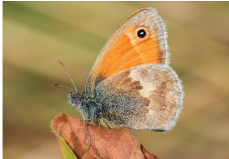
Hooibeestje (Sander Meertens)

Niet dat het Hooibeestje ( Coenonympha pamphilus ) in ons land nu zo'n zeldzame verschijning is, maar sinds de jaren '90 van de vorige eeuw is deze soort vrijwel uit Zoetermeer verdwenen. Een mogelijke oorzaak zou kunnen zijn de door verruiging hogere hooilandvegetatie in de Zoetermeerse parken. Zo wordt het Hooibeestje nog maar zelden gezien op telroute nr. 154 (de Westerparkroute).