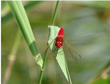
Vuurlibel (Hans Lucassen)

2018 was wat het weer betreft een bijzonder jaar. Het warmste en samen met 1976 ook het droogste jaar, ooit gemeten! Na een aantal verrassende voorjaarswaarnemingen van de Gevlekte witsnuitlibel in het Prielenbos werden er ook in het libellenreservaat nieuwe soorten gespot.