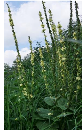
Zwarte toorts (Peter van der Aart)

Van buiten het stedelijk gebied kregen we ook twee waarnemingen: Op 16 augustus vond A Burgstad langs het fietspad bij de Nieuwe Hoefweg tussen Benthuizen en Bleiswijk een prachtig exemplaar van de Zwarte toorts.