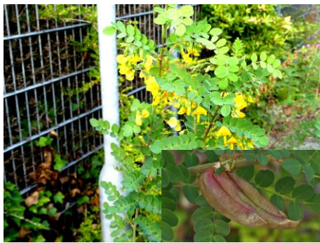
Europese blazenstruik met als inzet de blaas (Fred Reeder)

Op donderdagavond 16 augustus waren we weer terug op het Bredewater. Veel terreinen hier zijn afgesloten maar een terrein rondom een leegstaand pand, incl. parkeerterrein was, net als in april wel toegankelijk. Opmerkelijk daar was de spontane uitzaai van een vlinderbloemige struik die na enig speurwerk de Europese blazenstruik ( Colutea arborescens ) bleek te zijn. Naast deze nieuwe ontdekking troffen we ook een uitgebloeid gras aan dat we niet konden thuisbrengen. Vervolgens bleek hetzelfde gras ook onderdeel te zijn van het Griffioenassortiment dat een deel van de bermten aan het Bredewater siert. De vaste planten