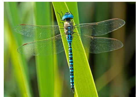
Zuidelijke glazenmaker (Hennie Cuper)

De Zuidelijke glazenmaker wordt in de vlucht gemakkelijk verward met de Paardenbijter. De helderblauwe ogen en achterlijf en de grotendeels groene borststukzijden zijn opvallend en doen denken aan de Grote keizerlibel. De pterostigma's (lang gerekte vlekken aan de voorzijden van de vleugels) zijn langer dan die van Paardenbijter. Verder is van deze soort bekend dat het de enige glazenmaker is die de eieren als tandem afzet.