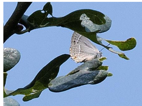
Eikenpage (Simon Post)

Ook de Eikenpage ( Favonius quercus ) wordt in Zoetermeer vrijwel nooit waargenomen. Waarschijnlijk komt dat niet omdat deze soort zo zeldzaam is in Zoetermeer, maar omdat de soort zich hoog in bomen en struiken ophoudt. Zo heb ik wel eens een ervaren 'vlinderaar' horen zeggen dat als je op je rug gaat liggen met een kijker gericht op de boomtop van een eik, je altijd wel eikenpages ziet vliegen. Zowel Henk de Hoog als Simon Post zagen deze vlinders op 4 juli jl. in het Buytenpark en wist Simon ook nog een foto te maken!