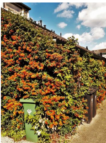
Besdragende struiken in de wijken (Fred Reeder)

Wanneer deze nieuwsbrief wordt rondgezonden zijn de activiteiten van plantenwerkgroep en libellentellers op een laag pitje gezet, hun seizoen is vrijwel voorbij. Allen de stadsplantenochtend in het dorp en de Eindejaarsplantenjacht in december zorgen nog voor activiteiten. De vleermuizen gaan binnenkort beginnen aan hun winterslaap. De vogelwerkgroep is druk bezig met de najaarstrek maar daar berichten wij niet over. De paddenstoelen werkgroep daarentegen gaat het hele jaar rond gestaag door. Maar ook buiten de werkgroepen is er veel moois te zien in Zoetermeer. Een dikkere jas en soms de paraplu zijn de attributen die extra nodig zijn om van de natuur te genieten. In de groenzones wordt weliswaar druk gemaaid maar de besdragende bomen en struiken geven mooie tinten aan het landschap en in de wijken.