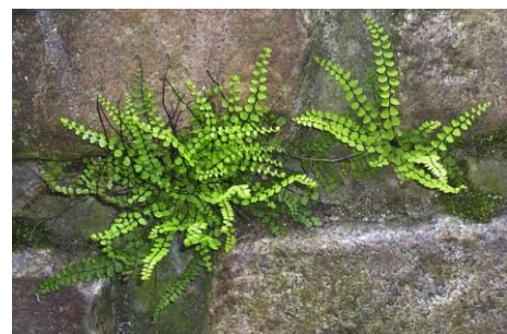
Steenbreekvarens, voor de grote schoonmaak op de muur in Buytenwegh (Johan Vos)

Muurvarens genieten in Zoetermeer vanwege de 'Gedragscode voor het zorgvuldig handelen bij bestendig beheer en onderhoud' tot 2020 bescherming. Hoewel weinig oude muren de grote groei van Zoetermeer overleefd hebben, bleken ook modernere muren al gauw geschikt voor Muurvarens, Steenbreekvarens en Tongvarens. De grote kademuur van basaltblokken op de kop van de hoofdtocht in Buytenwegh (van Eedenhove) was een mooi voorbeeld van zo'n groeiplaats. De verbazing was dan ook groot toen we zaterdag 22 september ontdekten dat de muur volledig was schoongemaakt en waar nodig opnieuw gevoegd!? Dit terwijl we deze groeiplaats regelmatig hebben gemeld. Het enige wat we nog kunnen doen is navragen bij de gemeente wat er is misgegaan.