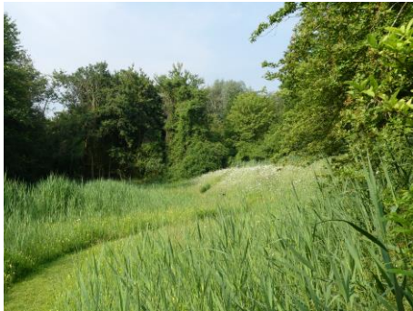
Natuurtuin (Fred Reeder)

Ooit ben ik ernstig berispt toen ik zei dat bepaalde natuurgebieden voor het publiek gesloten