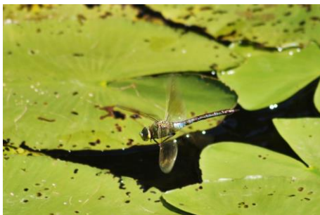
Zuidelijke keizerlibel (Bart van Berkel)

Naast deze nieuweling werd op 31 juli jl. door Bart van Berkel ook de Zuidelijke keizerlibel ( Anax parthenope ) waargenomen.