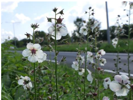
Mottenkruid (Peter van der Aart)

Op 1 september fotografeerde Peter van der Aart langs de Zoetermeerse rijweg zowel Zwarte toorts als Mottenkruid