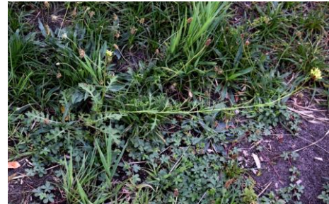
Schijnraket (Johan vos)

Op donderdagavond 2 augustus was Zoeterhage weer aan de beurt. Verrassend hier was de vondst van Schijnraket ( Erucastrum gallicum ), een zeldzame soort die in dit KM-hok ook al in 1998 (20 jaar geleden) werd aangetroffen. Verdere opvallende vondsten waren: Bolletjesraket ( Rapistrum rugosum ) en Amerikaanse kruidkers ( Lepidium virginicum ). Deze tijd van het jaar zou je ook wel de ganzenvoentijd kunnen noemen. We troffen het hele Zoetermeerse sortiment aan met de Zeegroene ganzenvoet ( Chenopodium glaucum ) als meest bijzondere.