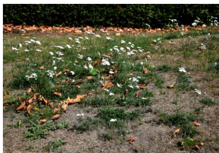
2018, het jaar van het Duizendblad (Johan vos)

Klimatologisch gezien was 2018 een bijzonder jaar. Na een koud voorjaar kon de zomer in juli en augustus niet meer stuk. Een voorproefje van het Middellandse zeeklimaat dat ons te wachten staat? Het was heet en vooral gedurende lange tijd erg droog. Op de vochthoudende Zoetermeerse kleigrond had de plantengroei ogenschijnlijk weinig last van de droogte maar op de zandige taluds of op plekken waar de vegetatie niet onder invloed stond van het grond-/oppervlaktewater hielden, te midden van al de verschroeiide grassen alleen droogteresistente soorten stand. Zo was het dit jaar een bijzonder goed jaar voor het Duizendblad, dat vrijwel de hele zomer volop in bloei stond. Een ander bijzonder verschijnsel was dat de vele platanen massaal hun schors lieten vallen. De verklaring hiervoor is simpel, platanen gedijen goed bij hoge temperaturen en