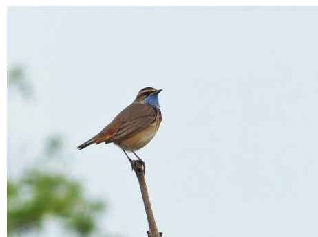
Blauwborst gemeld op 24 maart door Winfried van Meerendonk

Het laatste rubriekje wordt opgesierd door foto's van enige lentebodes.