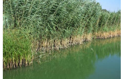
De Benthuiserplas op 2 augustus 2018 met een explosie van blauwalgen (Johan Vos)

In 2014 waren het flora (water en oeverplanten), vogels, grondgebonden zoogdieren, vleermuizen en aquatische macrofauna. In de 12 jaar na de nulmeting heeft de natuur in en om de BHP zich ontwikkeld tot een moerassysteem waar riet, natte ruigte en wilgenopslag het beeld bepalen. De eilanden zijn, voor zover ze continue droog staan begroeid met ruigte en wilgenopslag. Leuke soorten waren: Brede en Rietorchis, Blauwe waterereprijs (1ste waarneming in Zoetermeer) en Moeras- en Goudzuring (plas-/dras). De visdiefjes hebben voor het grootste deel plaatsgemaakt voor kokmeeuwen. Van de positieve ontwikkelingen elders in het gebied (Noorhovense poelen) profiteert ook de BHP.