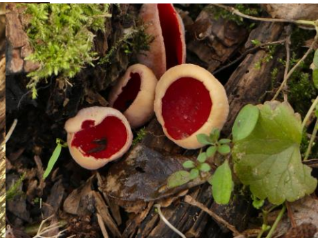
Rode kerkzwam