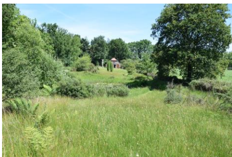
De Londotuin bij kasteel Broekhuizen in Leersum in 2017