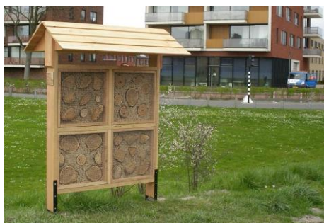
Het bijenhotel in park Palenstein (Johan Vos)

Dat de gemeente voor deze prijs in aanmerking is gekomen dankt zij o.a. aan het natuurlijk groen dat al vanaf eind jaren '70 van de vorige eeuw in de groene zones en parken van de stad floreert. Natuurlijk groen helpt dus echt bij het creëren van stedelijke biodiversiteit!