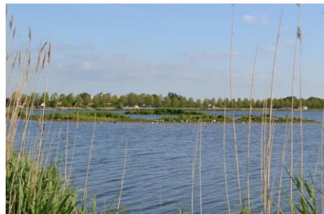
De Benthuizerplas op 15 mei 2014 (Johan Vos)

De Zoetermeerse natuurkernen bezitten optimale condities voor plant- en diersoorten die profiteren van de specifieke omstandigheden van het gebied in kwestie. Ze leveren daarmee een bijdrage aan het verhogen van de Zoetermeerse biodiversiteit. Bij de BHP gaat het vooral om moerasplant- en diersoorten die profiteren van kalkrijk, minder voedselrijk water. De geïsoleerde eilanden staan garant voor de afwezigheid van menselijke bemoeienis.