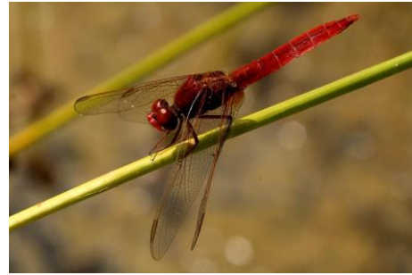
Mannetje Vuurlibbel in 2018 weer terug in het libellenreservaat (Kars Veling)

Van de libellen valt zowel slecht als goed nieuws te melden. Landelijk gezien is de positieve trend tot 2010 omgebogen naar een lichte teruggang. Beschouwen we alleen de laatste 10 jaar, dan zien we 19 soorten achteruit en 20 vooruit gaan. Waarschijnlijk is het effect van de verbeterde waterkwaliteit inmiddels grotendeels uitgewerkt. Vanwege het opwarmend klimaat gaat het gemiddeld goed met soorten van zuidelijke herkomst. Voorbeelden, die in 2018 ook in Zoetermeer zijn waargenomen zijn: Vuurlibbel, Zuidelijke glazenmaker, Zuidelijke keizerlibel en heel spectaculair de Gevlekte witsnuitlibel in het Prielenbos! Helemaal spectaculair was de waarneming van de Sierlijke witsnuitlibel in het libellenreservaat op 27 mei 2017 door Hans Lucassen. (zie de KNNV-Nieuwsbrief nr. 24, pag. 21)