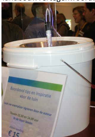
Presentatie nachtvlindertrap op de vlinderdag in Wageningen