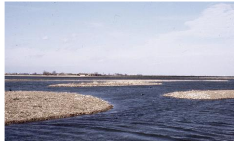
De Benthuizerplas direct na de aanleg in 2001 (Johan Vos)