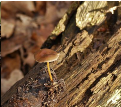
Bittere dennenkegelzwam (Fred Reeder)