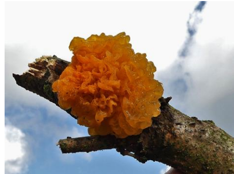
Gele trilzwam (Fred Reeder)

Uit bijgaande foto's blijkt maar weer eens te meer dat er in de natuur, lees parken, van Zoetermeer er altijd nog wel wat te zien is. Toegegeven voor het kleine spul zoals op de foto van het Franjekopje is de aanwezigheid van een kenner wel erg handig. Daarentegen zijn de vuistgrote Gele trilzwammen makkelijk te herkennen. In het dennenbos tegenover de ingang van het crematorium werd tot vreugde van het groepje paddenstoelenzoekers een exemplaar van de Bitteredennenkegelzwam gevonden en zoals ieder jaar in het vroege voorjaar zijn op diverse plaatsen de Rode kerkzwammen te vinden. Op onze website is het volledige