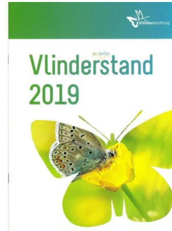
Vlinder en libellenstand 2019

Rode lijsten (RL) zijn gebaseerd op data uit het landelijk meetnet vlinders en waarnemingen van vrijwilligers. Er wordt gekeken naar trends en zeldzaamheid sinds 1950. Ondanks het feit dat zich wel wat verschuivingen hebben voorgedaan is de nieuwe RL even lang als de oude. Slechts 29 soorten (38%) van de RL 2019 zijn niet bedreigd.