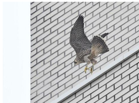
Slechtvalk (Simon Post)

Zie ook: http://www.roofvogels-hw.nl/slechtvalkenzh.php (vers van de pers!)