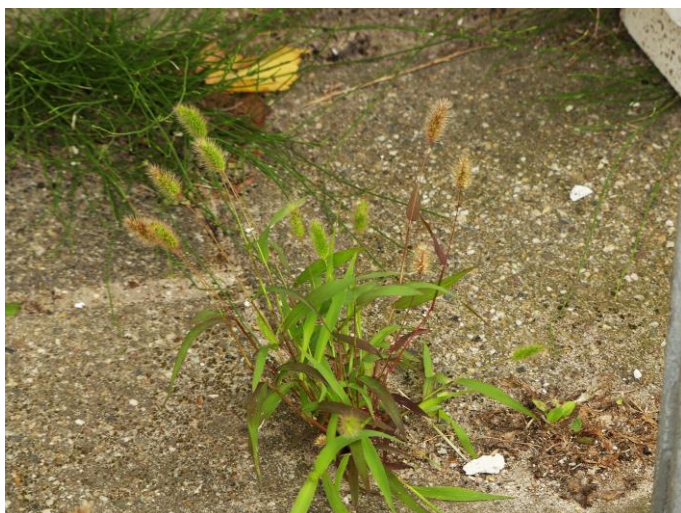
Groene naalbaar (Fred Reeder)

Na een lange zomer was het resultaat van de eerste regenbuien goed te zien op zaterdagochtend 6 september. De vegetatie stond er, voor zover nog niet gemaaid, fris en groen bij. Voor een heleboel soorten zelfs reden om opnieuw in bloei te komen. Zo troffen we op vele plaatsen bloeiende Glanshaver aan! Het was een mooie zwoele nazomerochtend.