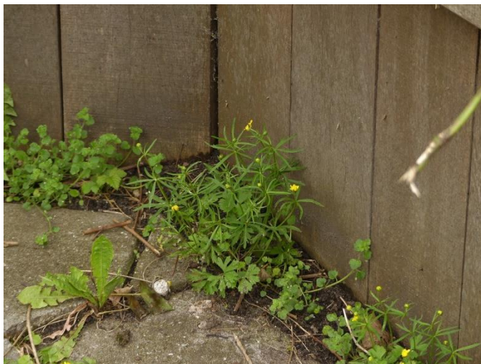
Gulden boterbloem (Fred Reeder)

In het kader van ons project “Staat die plant er nog” was het belangrijkste doel van de eerste planteninventarisatieochtend van 2018 de groeiplaats van de Gulden boterbloem controleren. Maar daar ben je niet zomaar. Over de route vanaf de verzamelplek aan de Turfberg tot aan de Valenberg (net een kilometer) deden we ruim 1,5 uur. Er werden veel kleine beginnende plantjes gevonden maar ook een grote groeiplaats van het Muskuskruid en natuurlijk de Gulden boterbloem die zich de laatste jaren steeds verder uitbreidt. Op het grasveldje van de Gulden boterbloem stond ook een