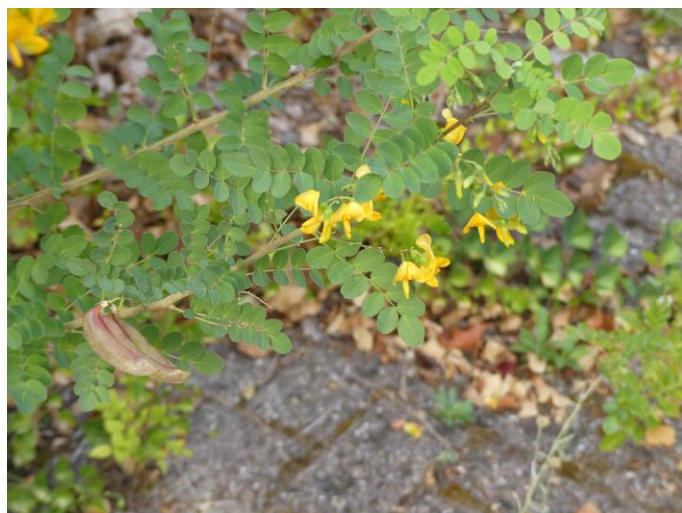
Europese blazenstruik (Fred Reeder)

Het in het voorjaar hier gevonden exemplaar van het Stinkend nieskruid stond er nog, evenals de drie draviksoorten: de Zachte, de IJle en de Zwenkdravik.