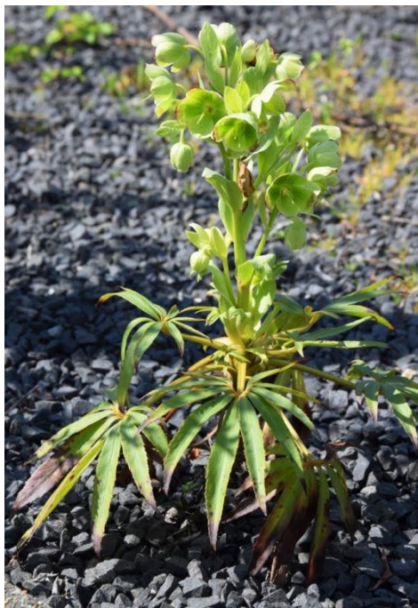
Stinkend nieskruid (Johan Vos)

Vanwege het thema “bedrijventerreinen” had Henk van tevoren contact opgenomen met een aantal bedrijven aan het Bredewater om toestemming te krijgen om daar te mogen inventariseren. Van