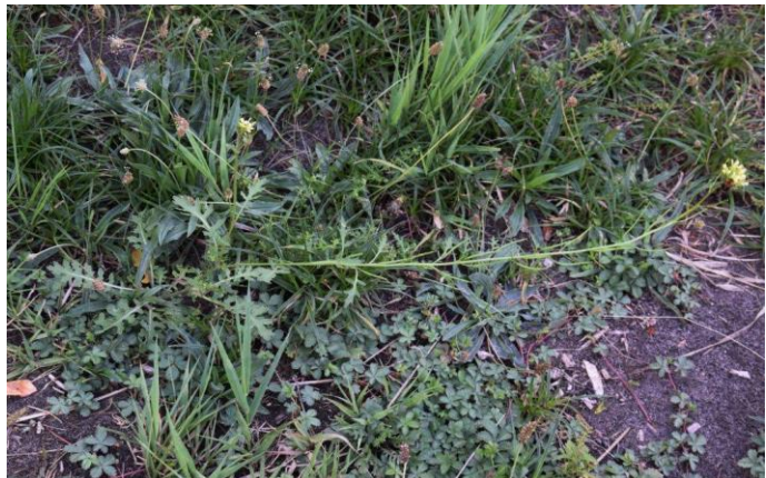
Schijnraket (Tilly Kester)

We waren met name geïnteresseerd in de braakliggende terreintjes waar in mei weinig tijd voor overgebleven was. Een leuke vondst daar was Schijnraket ( Erucastrum gallicum ), een plant van de kruisbloemfamilie met lichtgele kroonbladen, groenachtig dooraderd en schuin afstaande hauwen. Leuk is dat deze, in Zoetermeer zeldzame soort ook al in 1998 in dit gebied is waargenomen. Blijkbaar zijn veel soorten veel standvastiger dan wij ons kunnen voorstellen, zelfs in een stedelijk gebied.