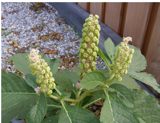
Bloeiende Karmozijnbes (Tilly Kester)

Leuke vondsten waren: Brede wespenorchis op 2 plaatsen, veel Hoge fijnstraal, uitgezaaide bomen en struiken, Glad walstro, Moerasspirea, Muurpeper, bloeiende Oosterse karmozijnbes (8 vruchtjes in een cirkeltje), ook bloeiende Kleine veldkers en een Hemelsleutel (die we niet verder op naam hebben gebracht). Veel tuinplanten probeerden de straat te veroveren, al dan niet met hulp van bewoners, wat het strepen er niet bepaald eenvoudiger op maakte. In sommige tuintjes waren de Buxushaagjes volkomen gesloopt door de