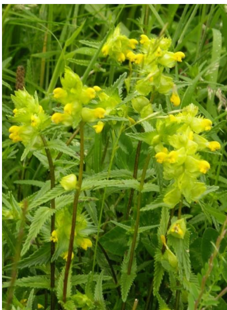
Grote ratelaar (Johan Vos)

Begin dit jaar hebben we ons met dit hoekje Zoetermeer aangemeld voor het zogenaamde nieuwe strepen. Het nieuwe strepen houdt in dat twee (groepen) tellers onafhankelijk van elkaar een route door het hok afleggen. Daarbij blijft de bezoekduur beperkt. (4-12 uur, afhankelijk van de complexiteit van het landschap) De bedoeling is dat je in die tijd zoveel mogelijk van de aanwezige biotopen bezoekt en zoveel mogelijk soorten vindt.