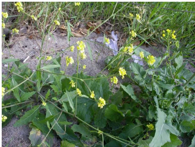
Bolletjes raket (Johan Vos)

Een aankondiging in de plaatselijke bladen resulteerde in 2 extra "floristen". Deze locatie was o.a. gekozen om te laten zien wat een stationsomgeving aan bijzondere soorten kan opleveren. Eerst werd de parkeerplaats onderzocht. We troffen er: 3 soorten melkdistel, Hertshoornweegbree, Bleekgele droogbloem en Zeepkruid, Ondanks dat er een gedeelte gemaaid was konden we het daar al jaren aanwezige IJzerhard terugvinden. Ook de Oosterse Karmozijnbes werd teruggevonden, nu schuin tegenover de plek van eertijds. Leuk was dat we deze avond de twee vormen van Kompassla aantroffen, de ene met gaafrandig blad en de ander met diep ingesneden blad. Bochtig veerspletig zoals dat in de "Heukels" wordt genoemd. Verscholen onder een overdaad aan braamstruiken werd Bolletjesraket gevonden.