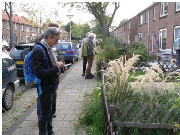
Straatbeeld