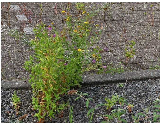
Heelblaadjes (Fred Reeder)

Bredewater bevinden zich een aantal kantoorcomplexen dat deels al tijden verlaten is. Dat biedt mogelijkheden voor de plantenwerkgroep en vooral parkeerplaatsen die jaren niet gebruikt worden, zijn interessant. Om de parkeerplaatsen van elkaar te scheiden waren op één van die terreinen stroken met basaltgrind aanwezig. Daar werden nogal wat uiteenlopende soorten genoteerd. In één van die grindstroken stonden Brede wespenorchis en het als redelijk vochtminnend bekend staande Heelblaadjes. Tussen de straatklinkers honderden exemplaren van de Bleekgele