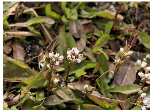
Deens lepelblad (Fred)

Volgend keer gaan we weer verder in dit km-hok. Nu 40 soorten en dat moeten er meer worden. Zolang Corona het niet anders toestaat gewoon met zijn tweeën.