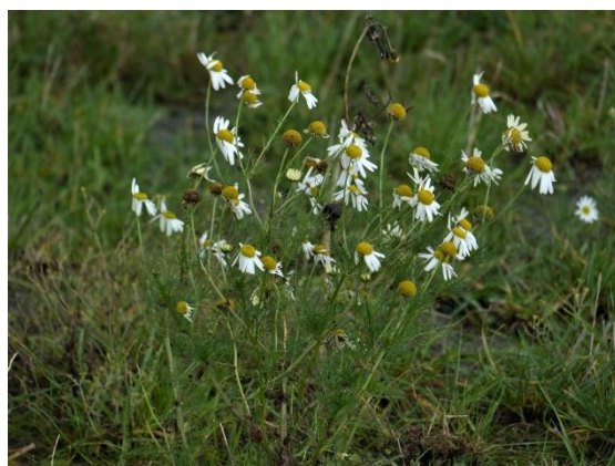
Echte kamille (Fred)

De weersomstandigheden waren nogal dreigend maar het grootste gedeelte van de tocht viel het mee. We noteerden nu zo'n 65 soorten waarvan er 19 soorten nog in bloei stonden. Opvallen