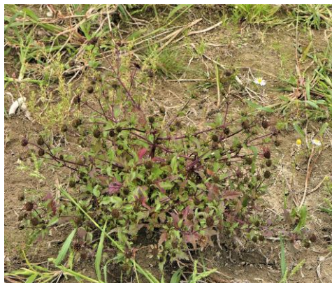
Zwart tandzaad (Fred)

Ook hier heeft men hele stukken niet gemaaid om de insecten een kans te geven om in dit gebied te overleven. De pas gemaaide vlakten gaven niet veel bijzonderheden ware het niet dat er nu op uitgebreide schaal Harig knopkruid was te vinden die we eerder daar niet gezien hadden of hadden gemist tussen de hoog opschietende planten, Bij het fietspad langs het dijkje