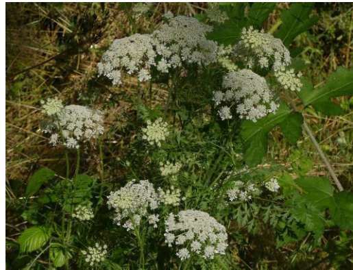
Wilde peen (Fred)

Na de vorige maal was er weer veel veranderd. De later bloeiende soorten als Donkere ooievaarsbek en Beemd ooievaarsbek bloeien nu voluit evenals Brunel. Jakobskruiskruid en nog steeds hier en daar een Rietorchis naast heel veel Harige ratelaar. Opvallende is het nu overal in het park