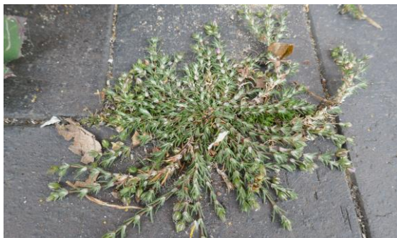
Rode schijnsparrie (Tilly)

Bijna aan het eind van de straat zag ik 2 soorten die ik niet thuis kon brengen. De ene stond tegen een deurpost en was een schermbloemige. De andere soort heb ik opgezocht via waarneming.nl, het bleek Rode schijnsparrie te zijn, een nieuwe soort voor Zoetermeer! Het bloeide nog niet, maar