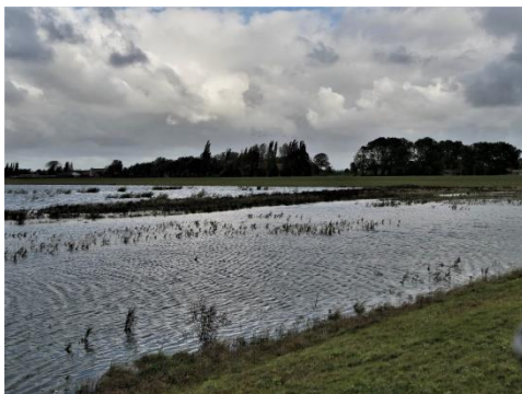
Ondergelopen vindplaatsen (Fred)

Het Moerasvergeet-mij-nietje weet zich nog te handhaven aan de waterkant, De behoorlijke golfslag liet de plantjes net met rust.