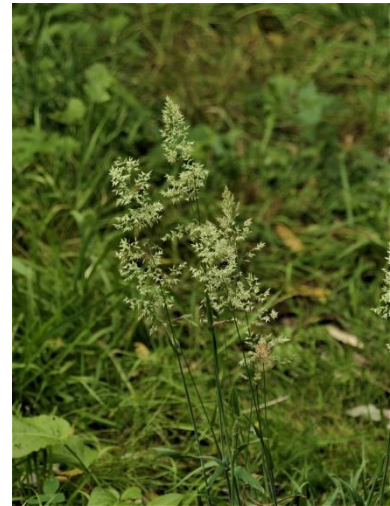
Gestreepte witbol (Fred)

alarmroep. Niet te missen als je buiten loopt. Verder lopend langs de route staan nog bloeiende exemplaren van de Gewone berenklauw, diverse grassen waaronder de Gestreepte Witbol en heel veel Bosveldkers. Het zal begin november er wel weer anders uitzien.