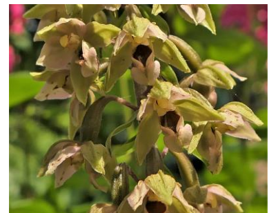
Brede wespenorchis (Fred)

verdwenen of geminimaliseerd. Jammer voor de bramenplukkers waartoe ik zelf ook