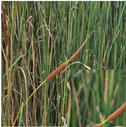
Kleine lisdodde (Fred)