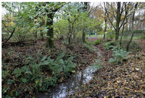
Ieder jaar toenemende varens (Tilly)

Op 25 november zijn we begonnen bij Bowling en Recreatiecentrum Westerpark. We zijn in de strook tussen de Heuvelweg en het water begonnen. Daar stond een en ander aan Mannetjesvarens. Langs dichte randen met bramenbegroeiing vind je weinig of geen varens.