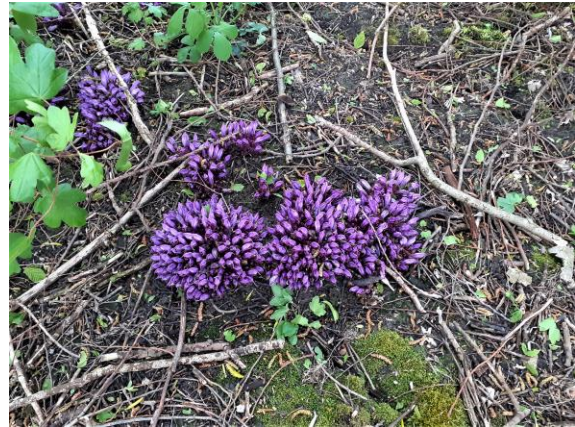
Paarse schubwortel (Fred)

In maart heb ik een route uitgezocht in km hok 90-452 met de opzet dat hok dit jaar eens per maand volgens een vaste route ( ca. 4 km) door te lopen. De natuurtuin laat ik buiten de route zo ook het gedeelte rond de sportvelden. Dat gedeelte zal ik incidenteel wel eens doen. Maart leverde nog niets memorabels op dus begin april de eerste ronde gelopen en nu , begin mei, de tweede. Veel van de begin april gevonden soorten stonden en staan nog steeds (door de kou?) in bloei zoals o.a. het Gewoon speenkruid. Ook de inmiddels buiten de natuurtuin te vinden Paarse schubwortel bloeit nog steeds. Het midden op de speelweide, ver van de natuurtuin aangetroffen, Slanke sleutelbloem is inmiddels tussen het hoge gras verdwenen. Ik wandel nogal veel in het