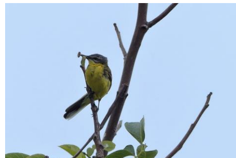
Gele kwikstaart met voer (Fred)