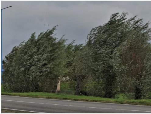
Wind kracht 6 a 7 (Fred)

Begin oktober strandde onze inventarisatie tocht al in het tunneltje. Hevige regen deed ons besluiten om maar een kwartiertje te schuilen. Dat bleek niet voldoende dus we zijn maar gestopt. Nu op de 22st oktober de tweede poging gewaagt. Met een forse stormwind maar droog hebben we ons rondje weer gelopen. Het beeld van de plantenwereld voor het tunneltje blijft zo'n beetje hetzelfde. Maar de aanblik van de N3MP verandert iedere keer weer. Was het de vorige maal nog kaal na het maaien, nu was alles weer groen. Tegen de stormwind in lopend werden we