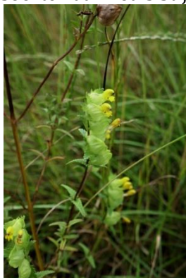
Kleine ratelaar (Tilly)

Op dinsdag 13 juli heb ik samen met Johan het hele gebied bekeken en een streeplijst gemaakt. Het was een zonnige en af en toe bewolkte dag. Aan de straatkant (Aidaschouw) was een grote plek met verschillende klaversoorten waaronder witte, rode, bastaard en hopklaver, elders in het veld witte en citroengele honingklaver. Naast veel bekende bermplanten troffen we ook een aantal bijzondere soorten aan zoals Stijf Hardgras, Walstroleeuwenbek en Kleine