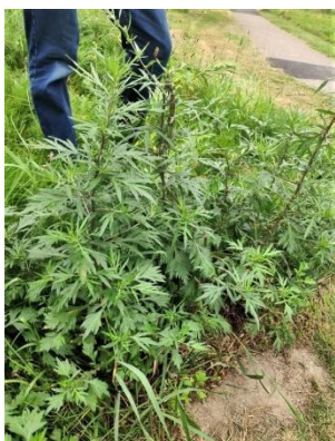
Herfstalsem of toch gewoon Bijvoet? (Peter)

door elkaar groeiend wat eerst enige verwarring veroorzaakte. Wat deze soorten betreft waan je je aan de kust! Gezien de lokale zandwinning in Zoetermeer al vele decennia is gestopt, komt zand tegenwoordig dus blijkbaar uit de duinen!