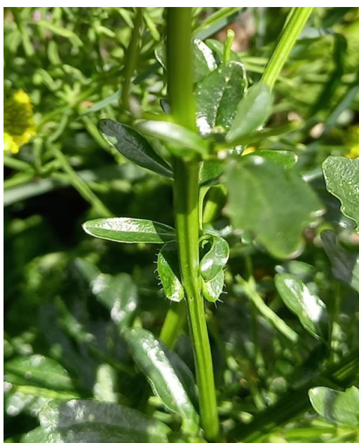
Bitter Barbarakruid met gewimperde oortjes (Anne)

Zaterdag 24 april liepen we door het bedrijventerrein om te inventariseren. We kwamen bij Weleda en daar zagen we wat ontsnapte planten die we niet meetelden, zoals Daslook. Aan de andere kant van het fietspad naast Weleda zagen we Barbarakruid, maar we wisten eerst nog niet zeker welke het was (Gewoon, bitter, of stijf). Obsidentify zei Bitter Barbarakruid, wij zochten thuis op soortenbank.nl en daar bleven we twijfelen. De oortjes moesten kaal of gewimperd zijn, de vruchten recht op staand of schuin afstaand. We zijn opnieuw langsgefietst om het te controleren. En kijk, gewimperde oortjes (zie foto!). Dus het is Bitter Barbarakruid.