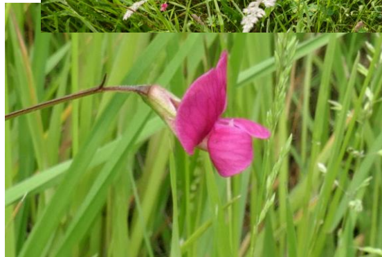
Gras lathyrus (Tilly)