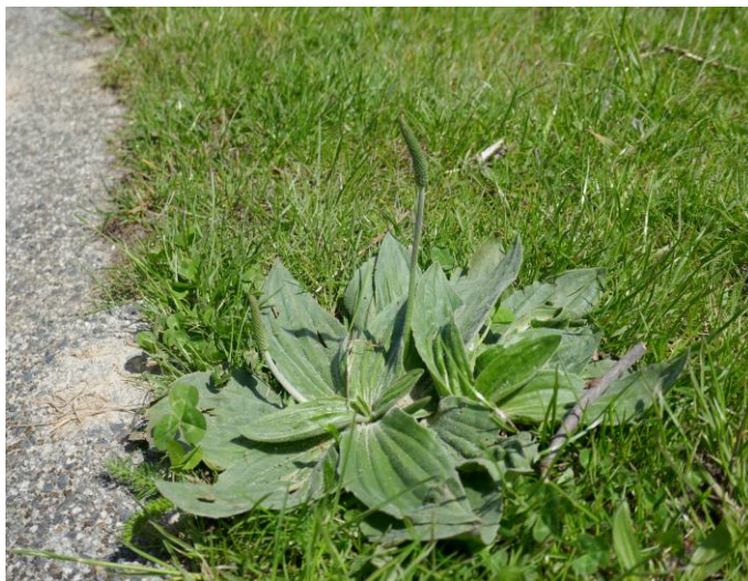
Ruige weegbree (Tilly)

In dit vochtig grasland zagen we Grote ratelaar, Echte koekoeksbloem, Moerasspirea en Valeriaan en een heleboel orchideeën nog niet in bloei, met en zonder vlekjes. Aan de waterkant zagen we Gewone dotterbloem, Watermunt, Zeegroene rus, Lidrus, Grote