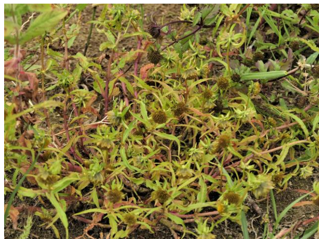
Knikkend tandzaad (Fred)

Terwijl we verder liepen vlogen rondom ons heen de Watersnippen verstoord op zodat we ons een beetje