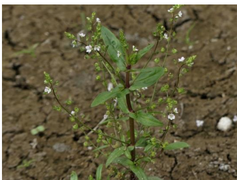
Rode watererepreis (Fred)

daar een Hazenpootje. Wanneer je onze route zou volgen dan loop je recht op een dijkje af met een fietspad om de waterberging heen. Daarachter ligt een gebied dat afwisselend deels onder water staat of droogvalt. Het waterpeil in de normale tijden, wanneer het gebied geen dienst doet voor waterberging, kan zo 40 cm variëren. Op die droog gevallen stukken wordt het leuk voor de planten liefhebber, Rode watererepreis, Beekpunge, en Waterweegbree groeien hier tussen de kleine planten van de Blaartrekkende boterbloem. Verder op waterrand het moerasvergeet-mij-nietje. Dit is een interessante plek die we de volgende maand weer gaan bekijken. Met een grote bocht draaiden we weer terug naar het tunneltje en naar de fietsen. En wil je weten hoe het met de Gele kwikstaarten gaat. Die zijn hun kroost druk aan het voeren.