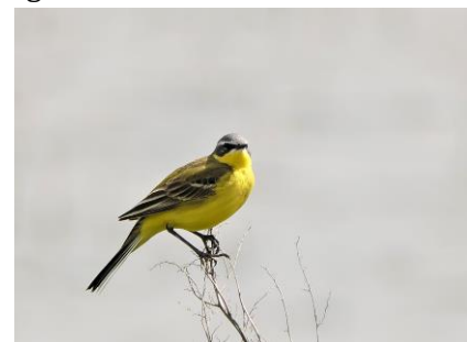
Grote gele kwikstaart (Fred)

In groten getale lopen hier vogelaars met camera's rond. Het is dan ook wel bijzonder om in deze regio soorten als Kleine en Bontbekplevier. Zwarte en Groenpootruiters, Kemphanen en nog veel meer te kunnen zien en fotograferen. Neem bij een wandeling in dit gebied een verrekijkertje mee, Ons rondje zat er weer op. Het bleek dat zelfs agenda's van pensionados vol kunnen staan dus begin juli wordt dit vervolgd.