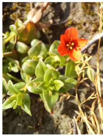
Rood guichelheil (Joke)