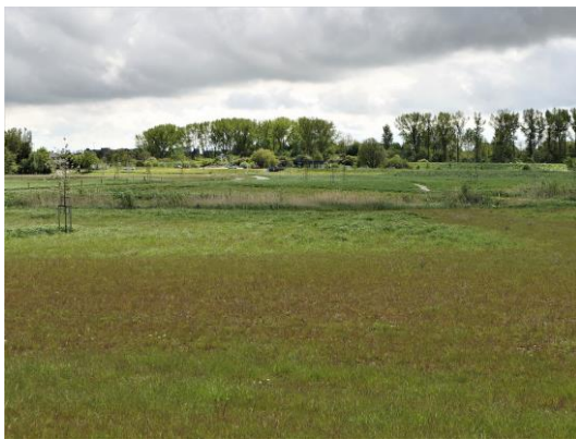
Scherp begrensde plantvakken in het hele gebied. Inzaaien? (Fred)

Aan de andere, N3MP kant, van het tunneltje loop je zo het gebied van de pionierplanten. Niet allemaal overigens want er is op ruime schaal hier ingezaaid. Alle nieuwe graspolletjes liggen keurig op rij zo ver je kijkt. Hele stukken zijn bedekt met grote planten van de rode klaver afgewisseld met stukken die kennelijk opzettelijk kaal zijn gehouden voor wat struik groei. Maar interessante soorten die niet zo massaal tegelijk en dicht op elkaar staand voorkomen staan er ook zoals Wilde cichorei, Ridderzuring en Veldzuring, Klein en Groot hoefblad. En niet te vergeten de overal opduikende, zij het soms zeer minuscule, Blaartrekkende boterbloem. In de nieuw aangelegde slootjes staan al Riet, Liesgras, Grote lisdodde en Gele lis.