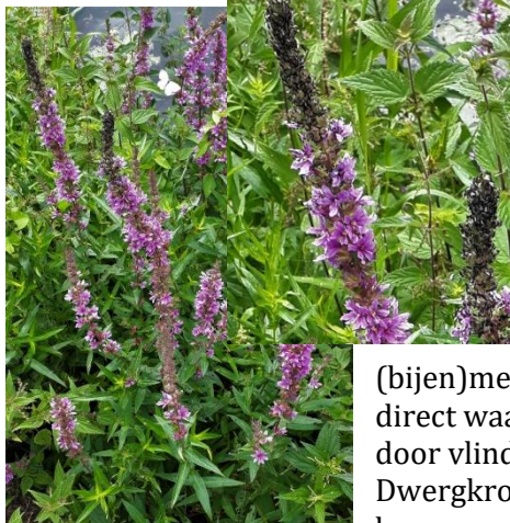
Grote Kattenstaart met belagers (Anne)

De niet gemaaide wegbermen waren voor een groot deel begroeid met Grote brandnetel! De verklaring hiervoor is dat er regelmatig slootbagger