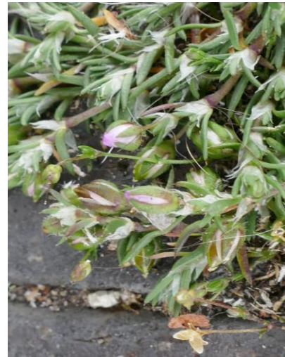
Rode schijnsparrie (tilly)

bij enkele bloemetjes zag je de roze kleur doorheen schijnen.