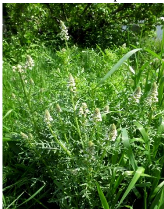
Witte reseda (Tilly)

voor een railverbinding die er nooit is gekomen en die is omgetoverd tot een schitterend lint van natuurlijk groen. Buiten al deze extra's blijft een gewone stedelijke km 2 een enorme diversiteit aan plantensoorten te bevatten. Letterlijk elk tuinpoortje kan voor een nieuwe verrassingen zorgen. Veel nieuwe stadsplanten worden daar geboren, het Kransgras is daarvan een prachtig voorbeeld. Een inventarisatieronde in een stedelijk hok is dus niet veel meer dan een steekproef. Een hok volledig in kaart brengen zou dagen duren en ook vele malen herhaald moeten worden gezien allerlei menselijke activiteiten en het beheer van de buitenruimte.