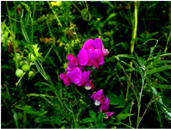
Brede lathyrus (Fred)

Inmiddels dit jaar al voor de vierde keer mijn vaste rondje door km-hok 90-452 gelopen. Ik had me voorgenomen dit jaar iedere maand een keer het blokje rond te lopen. En dit lijkt te gaan lukken.