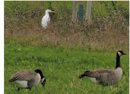
Veel vogels zijn er te zien in de N3MP (Fred)

daar aangenaam verrast door 4 Patrijzen die we zagen, Over vogels is er toch al niet te klagen want even verderop grote groepen Grauwe ganzen en Grote Canadees ganzen, Nijlganzen enz. Veel planten waren nu te zien als lage plantjes, net weer in bloei komend zoals de Wilde cichorei. Eenmaal bij de dijk aan het water gekomen bleek dat de vindplaats van Moeraszuring, Knikkend en Zwart tandzaad volledig onder water stond, De bloemhoofdjes van de Echte kamille staken hier nog net boven het water uit.