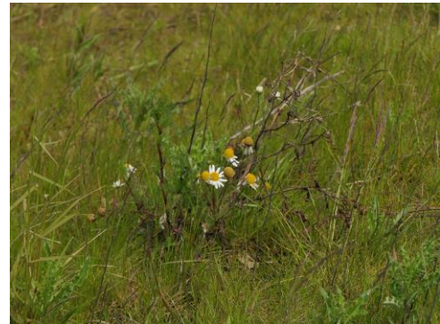
Reukeloze kamille (Fred)

We hebben inmiddels besloten om dit seizoen een min of meer vaste ronde door een gedeelte van ons km-hok (hok 90 – 453) te lopen om de veranderingen in het gebied te volgen en vast te leggen. Rond 15 april was de eerste keer en nu, 20 mei, dan de tweede keer. De overrijverige bermbeheerders hadden al hele stukken van de bermen bij het tunneltje onder de Leidschendammerweg onder handen genomen maar er stonden nog genoeg grassen en anders soorten om onze hersens eens danig over te pijnigen. Met als controle de Obsidentify-app kwamen we er toch meestal wel uit. En zoals altijd bij twijfel geen noteren.