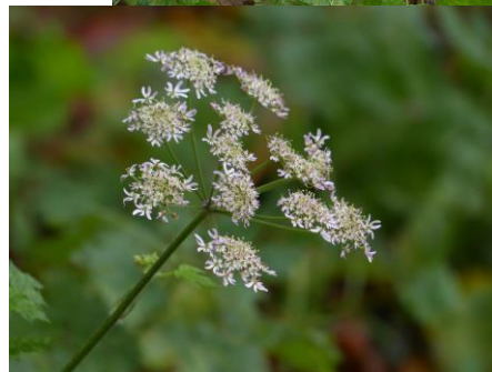
Gewone berenklauw (Fred)