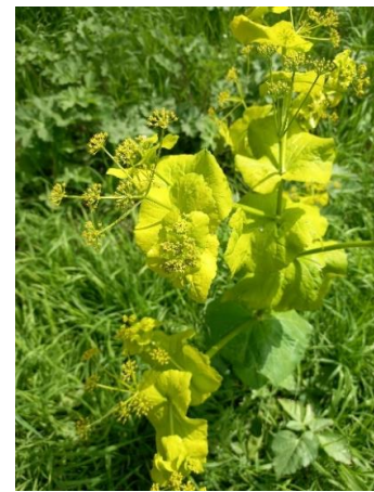
Doorwaskerve I (Joke)