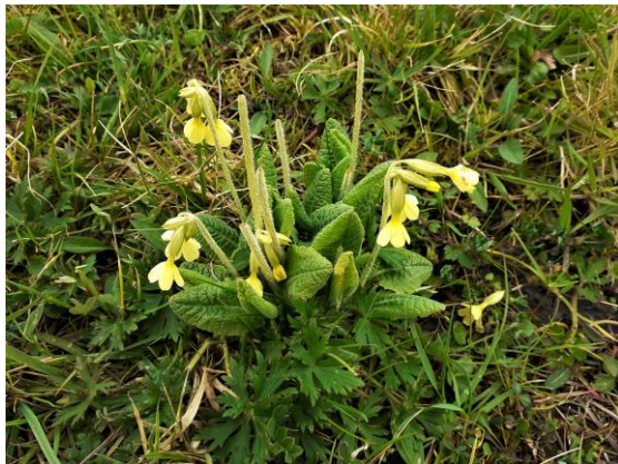
Slanke sleutelbloem (Fred)

Westerpark en zo valt op dat er steeds meer Stinse soort planten in het hele park gaan voorkomen en niet alleen in de bosstrook langs de A12. Maar ook in dit deel van het park.