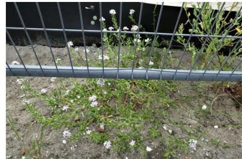
Zeeraket aan de rand van een bouwlocatie. (Tilly)

Toch was het nog lang niet afgelopen met de pret. Langs het bouwterrein aan het begin van de Burgemeester Middelberglaan deden we een aantal nieuwe onverwachtse ontdekkingen: Zeeraket en Smal vlieszaad