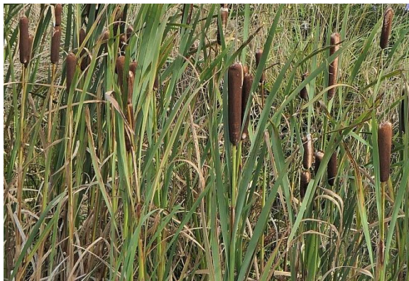
Grote lisdodde (Fred)

De meeste schade van de grote maaimachines die overduidelijk in het park zichtbaar was, is weer door de plantengroei bedekt. Gelukkig hebben ze dit keer dus veel laten staan voor de tweede maaironde. Maar je vreest wel voor de paden. De tractoren zijn tegenwoordig zo groot dat ze fietspad breed door het park rijden. Op of naast de paden het maakt kennelijk niet uit, maar goed er blijft nog veel heel. En reparaties leveren de uitvoerders binnenkort ook weer geld op. Veel van de planten van de eerste rondjes die ik gelopen heb komen na het maaien weer terug en de najaarsbloeiers komen goed op gang. De mooie Grote kattenstaarten kleuren samen met het Koninginnekruid de oevers. Langs de paden en op de grote vlakken staat Peen, Jakobskruiskruid en veel Klein Streepzaad. Het Groot heksenkluid is duidelijk al op zijn retour. De bramenstruiken zijn vorig jaar goed aangepakt want veel ervan zijn verdwenen of geminimaliseerd.