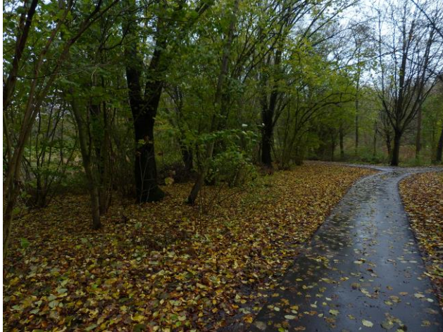
Herfst op de nieuwe paden (Fred)

hoornbloem en hier en daar nog een enkele boterbloem. Zeer spaarzaam een klaver en nog een Boskersje. De reeds eerder gesignaleerde Stokroos staat nog steeds in bloei met 2 bloemen.