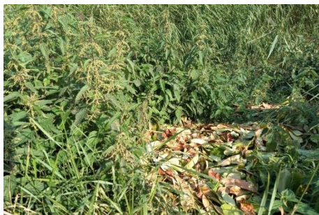
Baggesrslib enj groenafval (Joke)

Om de bewuste locatie te bereiken moesten we eerst ruim 8 km fietsen maar dat leverde geen problemen op. Het was bewolkt maar droog en er was nauwelijks wind.