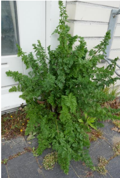
De schermbloemige onbekende (Tilly)

Om de vroegst bloeiende soorten mee te kunnen nemen, heb ik toch alvast een eerste inventarisatierondje in Oosterheem gemaakt. Ik ben ca 1,5 uur op pad geweest. Ik ben begonnen bij de rotonde van Stephensonstraat en Willem Dreeslaan/Oostlaan, waar voorheen het Gemeentelijke Informatiecentrum stond.