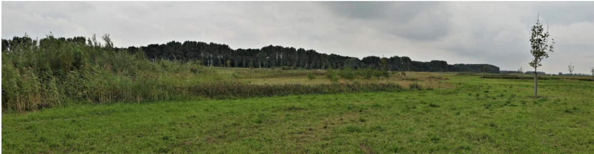
De gemaaide vlakten van de N3MP (Fred)

Inmiddels schrijven we alweer September dus op de tiende liepen we weer ons vaste rondje. We (Henk en ik) waren al snel door het vertrouwde stukje naar het tunneltje door al met de van vorige malen bekende soorten scorende en liepen toen de pas gemaaide vlakte van de N3MP op