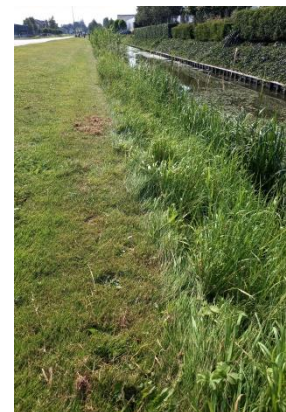
Gemaaide bermen (Joke)_

Een uitbundig bloeiende Grote kattenstaart was voedsel voor een heel leger van de een of andere belager, zie afbeelding. Wie weet om welke belager het hier gaat graag even een reactie naar: