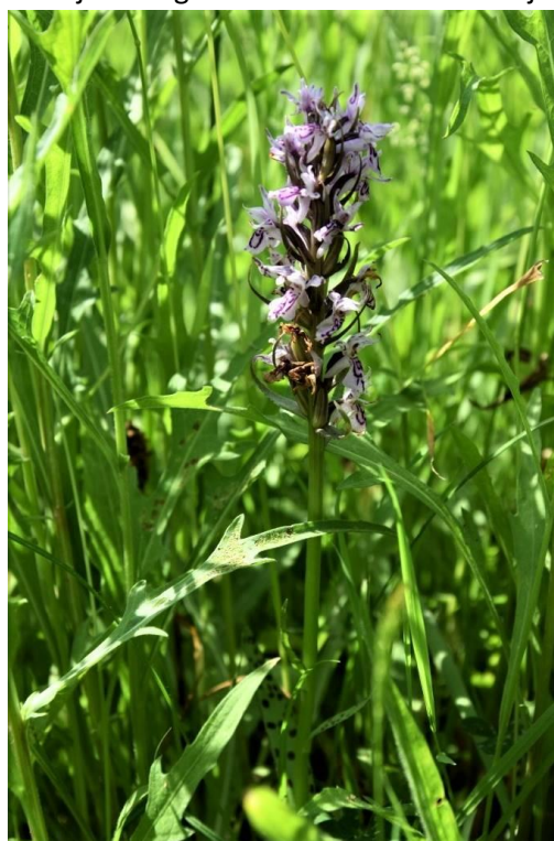
Dactylorhiza met kenmerken van de Bosorchis